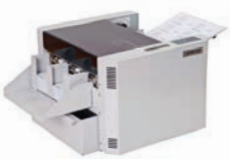
A4-Visitenkarten- und Digitaldruck-schneidemaschine CC 150