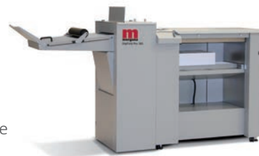
Saugluft-Rill- und -Falzmaschine DigiFold Pro 385