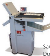
Saugluft-Falzmaschine Docufold Pro