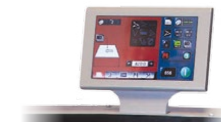
Das Cockpit der AutoCreaser Pro-Serie: Über den großen farbigen Touchscreen erfolgt die komplette Steuerung, Programmierung und Jobspeicherverwaltung.