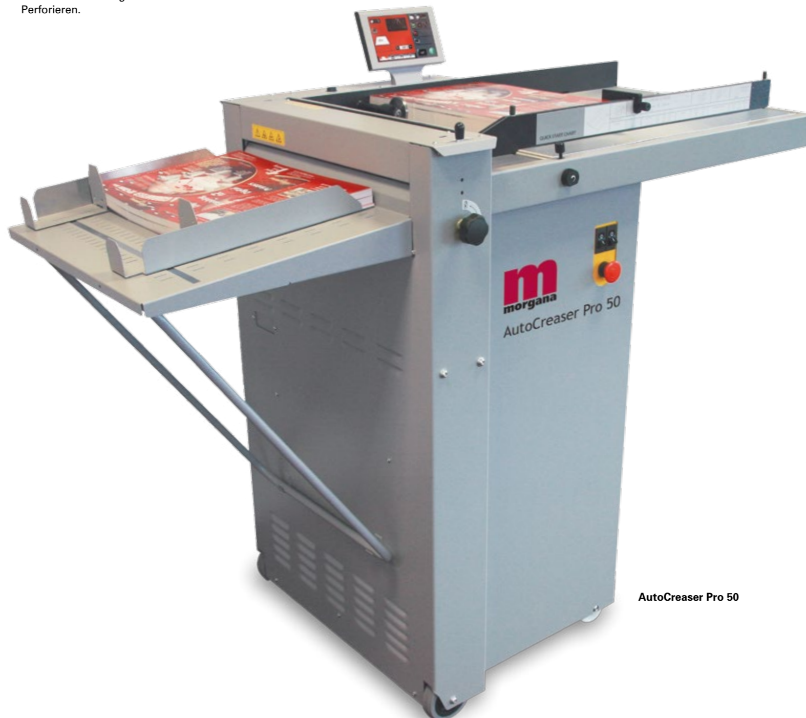
AutoCreaser Pro 50

Produktvideos unter www.hefter-systemform.com