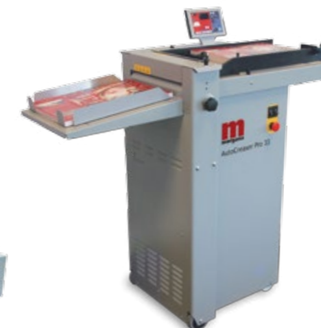
Die AutoCreaser Pro 33 kann ein Bogenformat bis zu 700 x 330 mm bearbeiten. Ansonsten verfügt sie über die gleichen Funktionen wie die größere AutoCreaser Pro 50 .