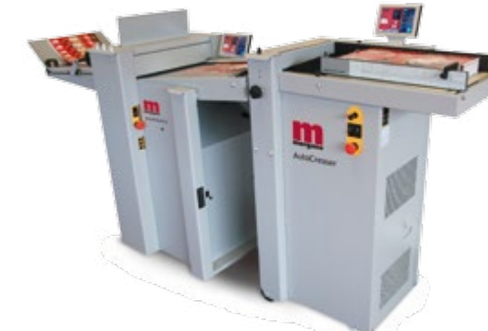
Inline-Anbindung der AutoCreaser Pro-Serie an die Falzmaschine AutoFold Pro : Rillen und Falzen in einem Arbeitsgang erhöht die Produktivität noch einmal wesentlich.