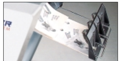
Gitterablage M 3000