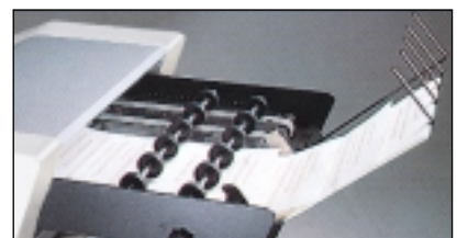
Schuppenablage M 3010