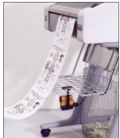
Online-Verbindung zu einem Drucker