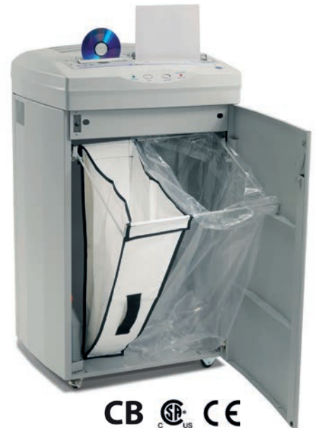
Getrennte Auffangbehälter für CD's/DVD's und Papier