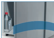
Automatische Ölschmierung der Schneidwellen