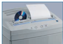
Getrennte Schneidwellen für Papier und CD's/DVD's