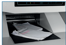
Bequeme und zuverlässige Förderbandzuführung