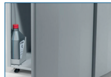
Automatische Ölschmierung der Schneidwellen