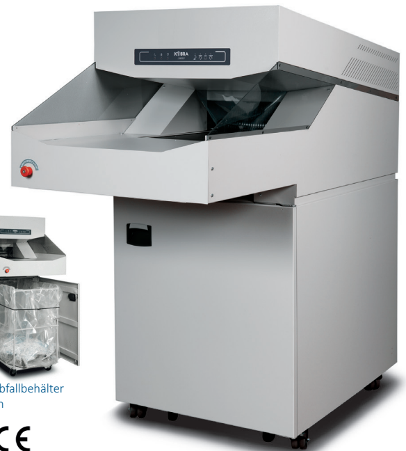
Großer Abfallbehälter auf Rollen