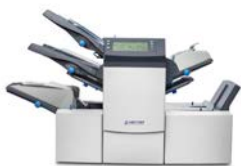
Kuvertiermaschine SI 3350