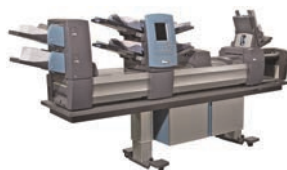
Kuvertiersysteme SI 5400