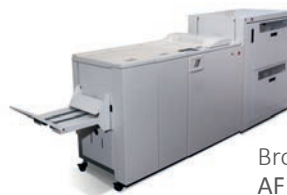
Broschürenfertigungssysteme AF 350 / 500 und VF 350 / 500