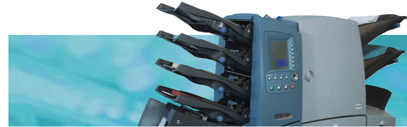
Die kompakten Kuvertierlösungen für maximale Anwendungsvielfalt