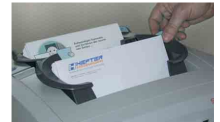
Kuvertzuführung und Beilagenstation