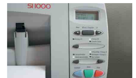
Display-Anzeige, einfache und schnelle Bedienung auf Tastendruck