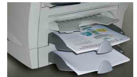
Zuführschacht für DIN A4 Formulare und Tagespoststation (zweiter A4-Schacht optional)