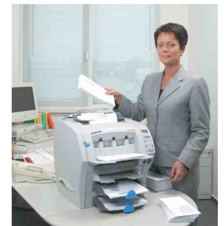
Der effiziente Helfer für Ihren Postausgang