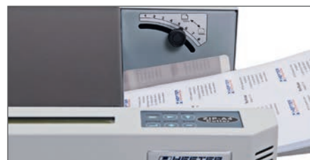
Einfache Bedienung und individuelle Einstellung der Papierstärke

Die fertig geschnittenen Endformate werden in einer universell einstellbaren Ablage sauber abgelegt und können von dort bequem entnommen werden. Extrem langlebige Längs- und Quermessereinheiten sorgen auch bei einer hohen Anzahl von Schnitten stets für ein professionelles Erscheinungsbild!