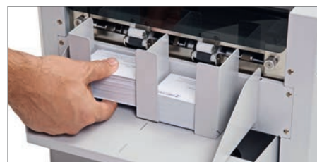
Universell einstellbare magnetische Ablage