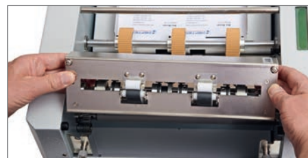
Die Messerkassette kann sehr einfach entnommen und gewechselt werden z.B. für Perforier- oder Rillmesser